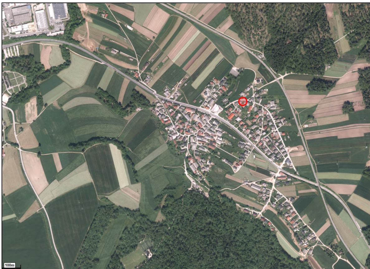
Slika 1: Lokacija merilnega mesta, označena z rdečim krogcem na DOF

Na sliki 1 je prikazana širša lokacija merilnega mesta na ortofoto, fotografija 1 pa prikazuje merilno mesto iz severozahodne smeri.