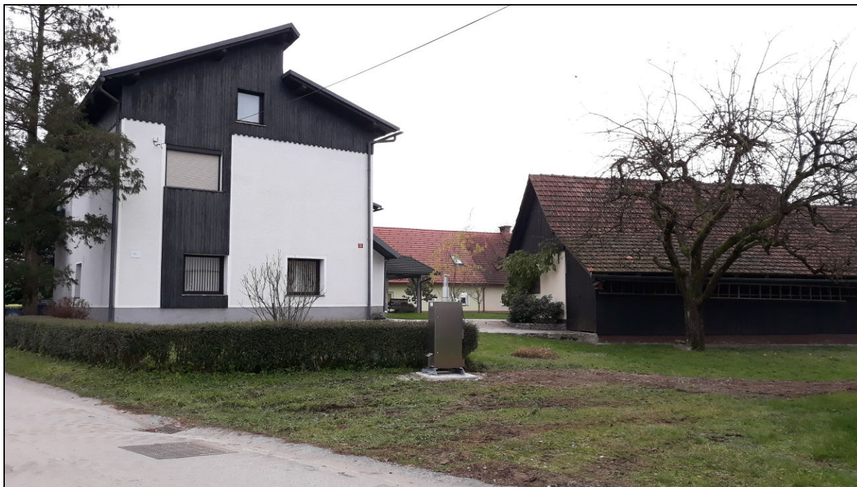
Fotografija 1: Merilno mesto iz severozahodne smeri, levo od merilnika stanovanjska stavba z naslovom Godešič 42. Merilno mesto z dovoljenjem lastnika na parcelni številki 19/10 k.o. Godešič

Mejne vrednosti za varovanje zdravja ljudi so predpisane v Uredbi o kakovosti zunanjega zraka (Ur. l. RS št. 9/11, 8/15, 66/18) in so navedene v tabeli 2.